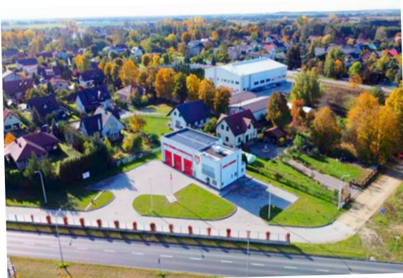
Dobroszyce – str. 10