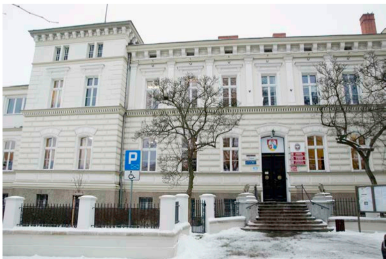
Urząd Miejski w Głubczycach

ul. Niepodległości 14 48-100 Głubczyce tel. 77 485 30 21 do 24 fax 77 486 24 16 um@glubczyce.pl www.glubczyce.pl