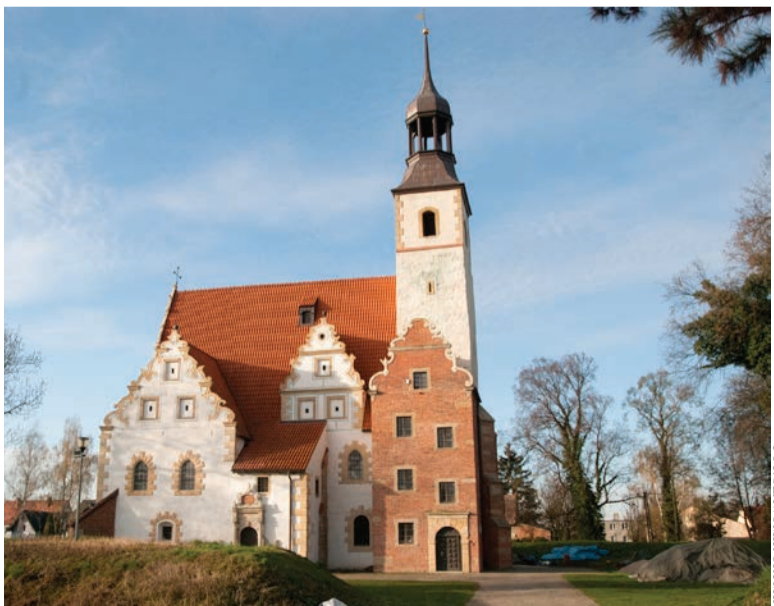
Kościół Świętej Trójcy w Żórawinie – skarb żórawiński i europejski, perła manieryzmu

Urząd Gminy Żórawina ul. Kolejowa 6 55-020 Żórawina tel. 71 316 51 05, 71 316 51 57 fax 71 723 49 00 urzad@zorawina.pl www.zorawina.pl