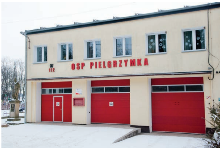
Remiza Ochotniczej Straży Pożarnej w Pielgrzymce