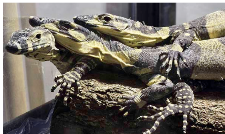
Warany kolorowe – bardzo urodziwe – pojawiły się we wrocławskim zoo