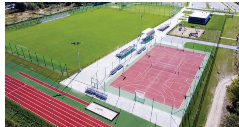
Kompleks stadionowy w Dobroszycach

strategicznym miejscem na mapie gminy, gdyż pozwoli stworzyć niezbędny lokalny węzeł przesiadkowy dla naszych mieszkańców, ale też i turystów. Jeszcze w tym roku to miejsce zamieni się w prawdziwą perełkę w postaci oświetlonego, monitorowanego, bezpiecznego punktu Park&Ride oraz Bike&Ride. Powstaną m.in. nowoczesne stojaki i aplikacja na jednoślady, zadaszona wiatra rowerowa, duży parking i zatoka autobusowa. To kolejny etap w rozwoju infrastruktury sprzyjającej mieszkańcom i przyjezdnym.