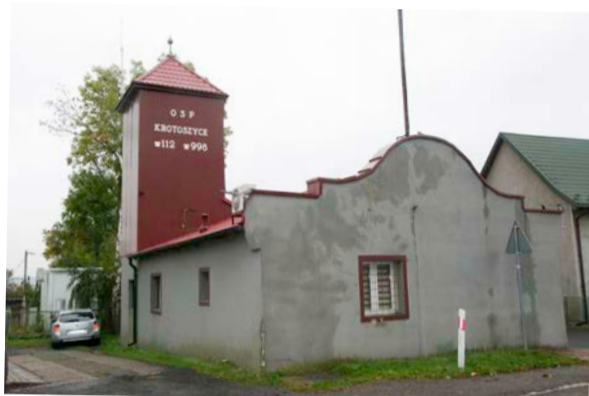
Krotoszyce – str. 10