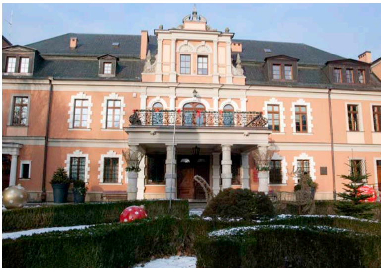
Urząd Gminy Kobierzyce