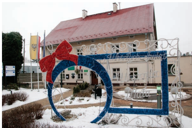
Urząd Gminy Wisznia Mała