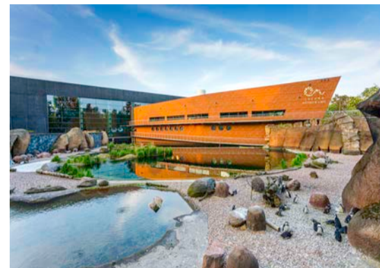
ZOO Wrocław – str. 16