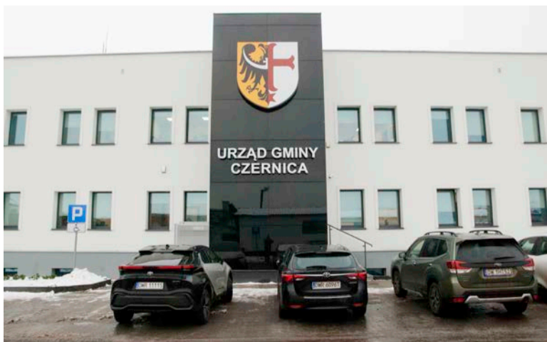
Urząd Gminy Czernica