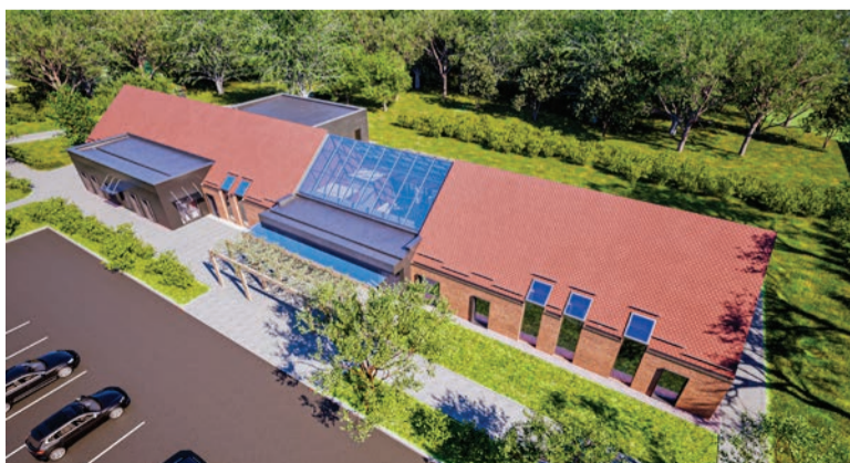
Wizualizacja nowego ośrodka zdrowia w Radwanicach