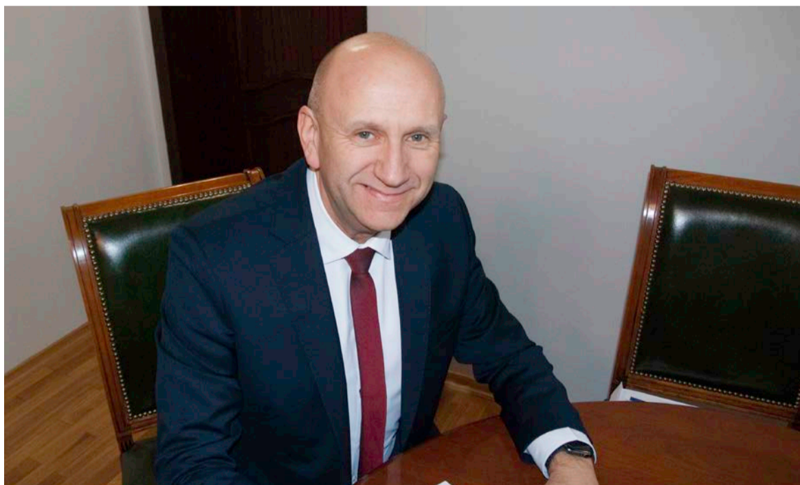
FOT. SŁAWOMIR GRZYMIŃ