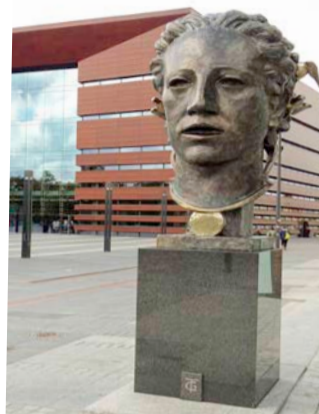
Wrocław – NFM – str. 4