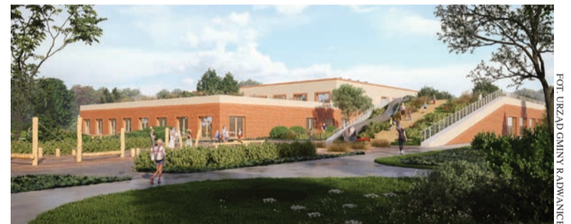
Wizualizacja przedszkola z oddziałami żłobkowymi w Radwanicach

że można u nas nieźle się rozwijać i realizować. Liczę na to, że to przyciągnie do nas nowych mieszkańców, aczkolwiek dobrze by było, aby ich liczba nie była od razu zbyt wielka. Najlepiej, aby osadnictwo rozwijało się na miarę naszych możliwości, bo wtedy budżet gminy będzie w miarę stabilny – będziemy się dalej rozwijać, bez ogromnych problemów infrastrukturalnych związanych z dużym napływem ludzi, a co za tym idzie budową nowej infrastruktury, m.in. drogowej, oświatowej i wodociągowo-kanalizacyjnej powodującej potężne wydatki, z którymi gmina może sobie nie poradzić.