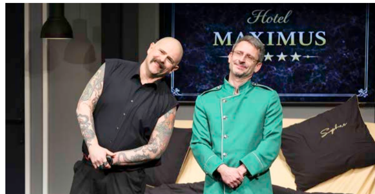
Od lewej: Ktoś i Portier Dany – obaj mają w hotelu wiele do zrobienia