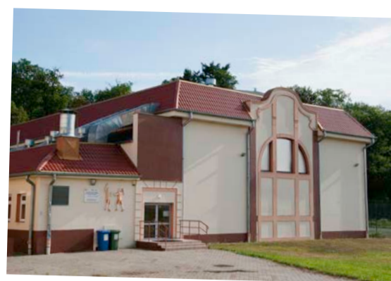
Pielgrzymka – str. 6