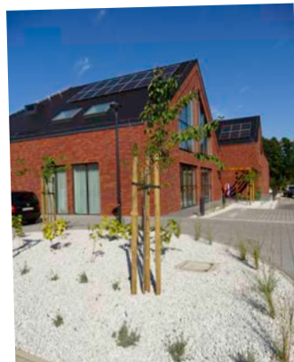
Radwanice – str. 12