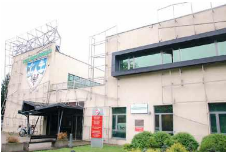
Urząd Gminy Długoleka

55-095 Długoleka ul. Robotnicza 12 tel. 71 323 02 03 fax 71 323 02 04 gmina@gmina.dlugoleka.pl www.gmina.dlugoleka.pl