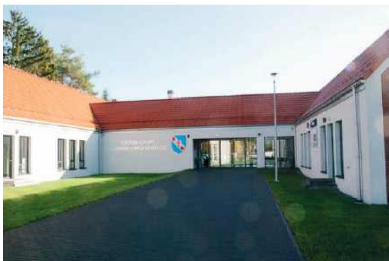
Pięknie wpisujący się w otoczenie, interesujący architektonicznie – Urząd Gminy w Dziadowej Kłodzie