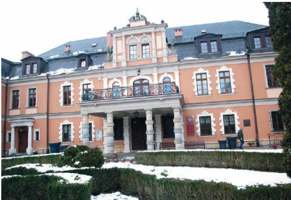
Urząd Gminy w Kobierzycach