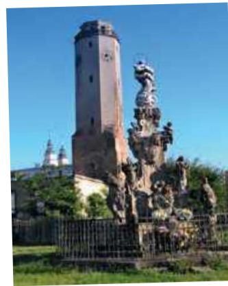
Głubczyce – str. 8