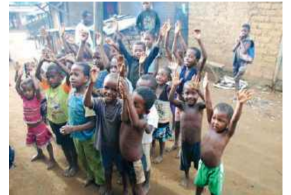
Madagaskar – str. 17