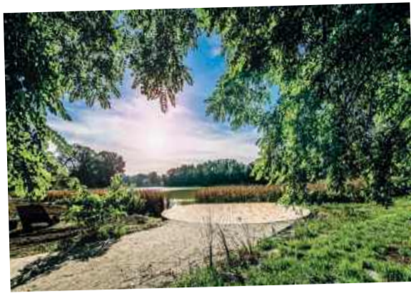
Długoleka – str. 7