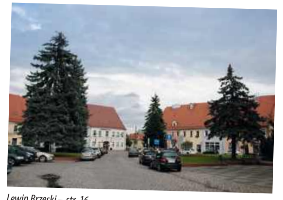
Lewin Brzeski – str. 16