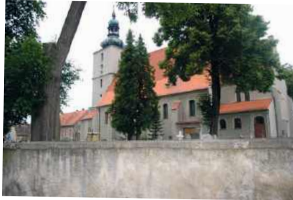
Domaniów – str. 13