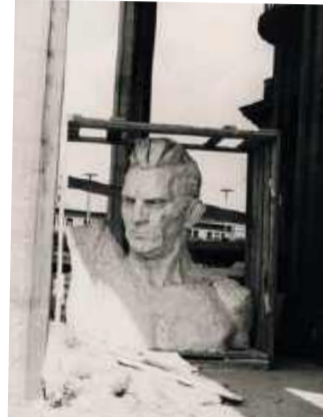
Muzeum Narodowe we Wrocławiu – str. 18