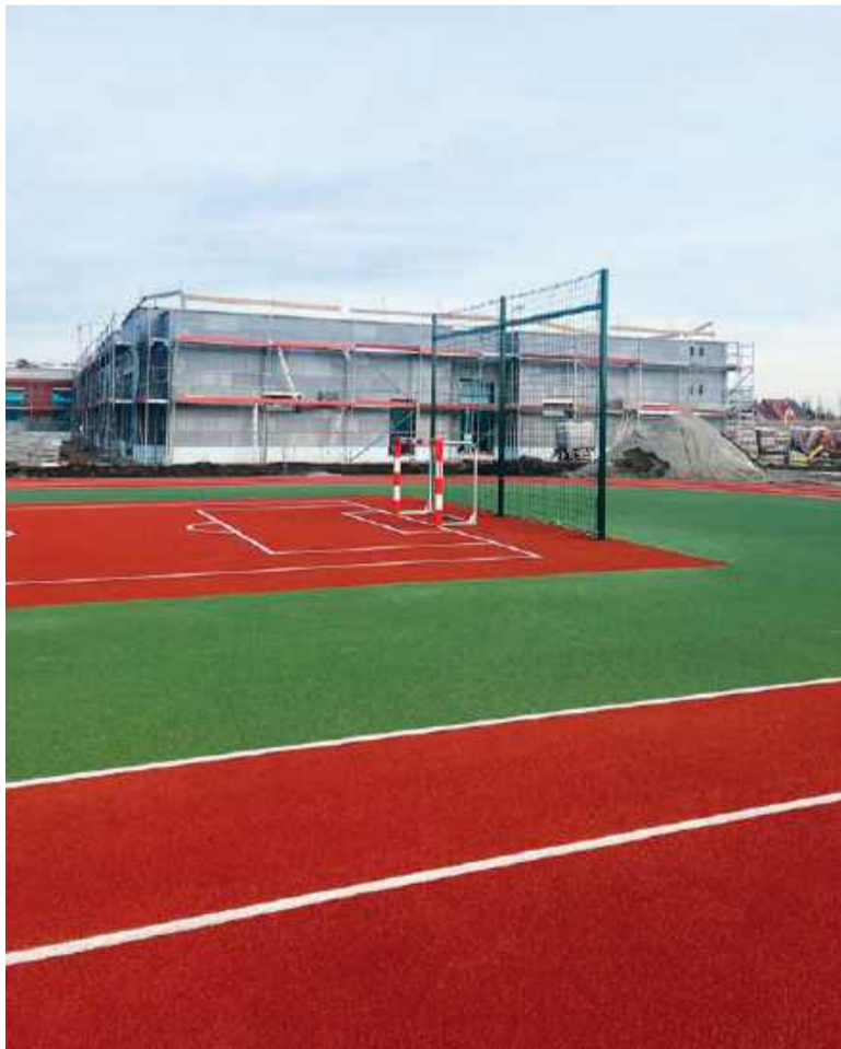
Przedszkole i boisko w Wierzbnie