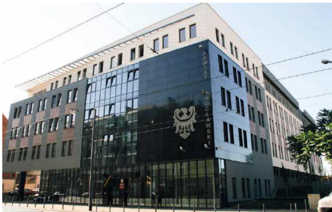
Starostwo Powiatowe we Wrocławiu