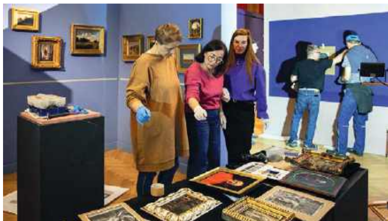
Przygotowania do wystawy „Obrazy w małych formatach ze zbiorów Muzeum Narodowego we Wrocławiu”

Jakiś czas temu lewicowy szef polskiego banku centralnego oznajmiał światu (wszystko wskazuje, że po spożyciu), że tylko duże ma znaczenie i on o tym wie. My dzisiaj jednak postawimy się w kontrze do byłego prezesa NBP i spróbujemy namówić naszych Czytelników (i nie tylko) do tego, by opowiedzieć się za małym (a czasami nawet całkiem malutkim) i tam dostrzec piękno. Prawdopodobnie wymaga to większego skupienia, większej spostrzegawczości, może nawet ciut więcej swoistej inteligencji w odszukiwaniu i odkrywaniu czegoś, co dla innych jest niewidoczne. Wierzmy jednak w naszych Czytelników (i ich znajomych), podobnie jak w swoich miłośników wierzy kierownictwo wrocławskiego Muzeum Narodowego. Bo to właśnie ta instytucja kulturalna (specjalnie jej przedstawiać i reklamować nie trzeba) zaprasza na wystawę czasową pn. „Obrazy w ma-