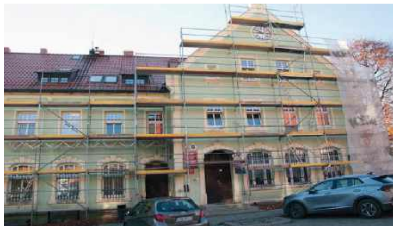
Termomodernizowany budynek Urzędu Gminy Dobromierz